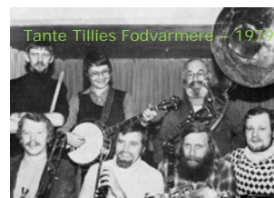
Tante Tillies Fodvarmere – 1979

Efter studier i jazzens Hvem Hvad Hvor blev sammensætningen justeret i 1971 med tilføjelse af klarinet og udskiftning af tværfløjte med trækbasun. Nu var det traditionelle jazzband på plads, og efter tilføjelse af piano og banjo gik det løs med "skrummerum" og fornøjet samvær. Orkestret spillede overalt i Danmark med stor intensitet og havde – især på Sydhavssøerne – et stort og trofast publikum.