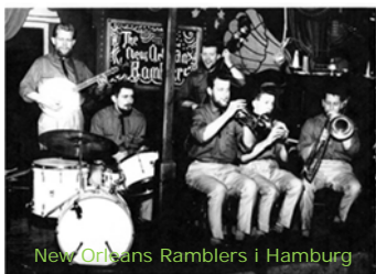
New Orleans Ramblers i Hamburg