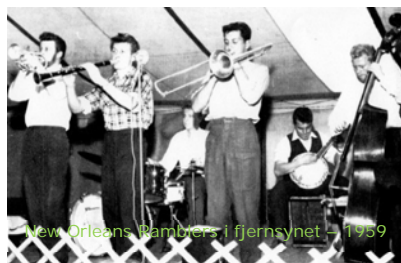
New Orleans Ramblers i fjernsynet – 1959